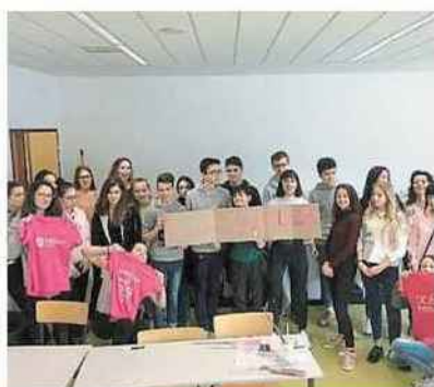
Des élèves mobilisés pour l'événement.